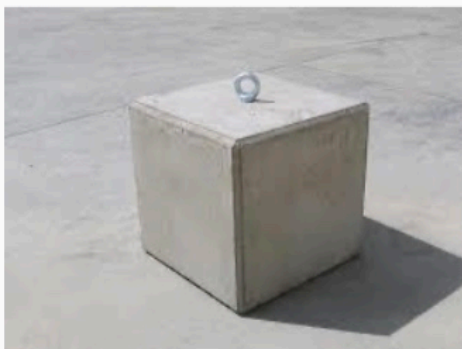
Lest en ciment,